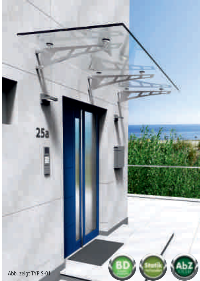
Abb. zeigt TYP S-01